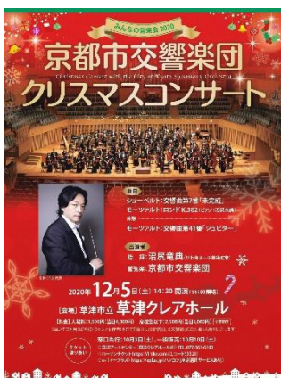
▼京都市交響楽団クリスマスコンサート

下記の他、劇団四季ファミリーミュージカル、サンリオファミリーミュージカル、おうみ狂言図鑑、ウィーン少年合唱団等を過去に公演しています。