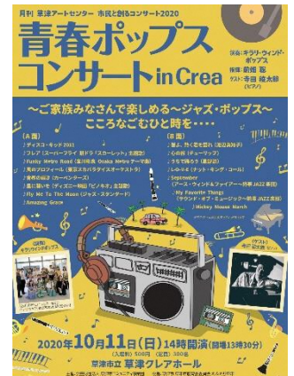
▼青春ポップスコンサートin Crea