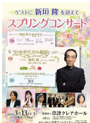
▼ゲストに新垣隆さんを迎えて スプリングコンサート