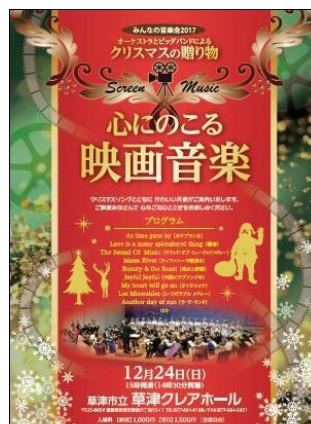
▼心に残る映画音楽