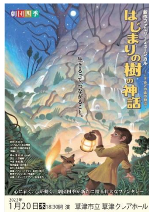
▼劇団四季ファミリーミュージカル