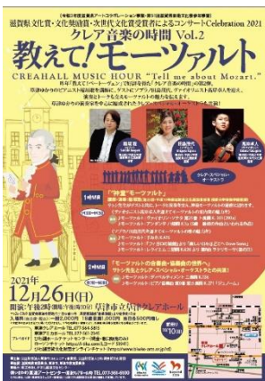
▼教えて! モーツァルト