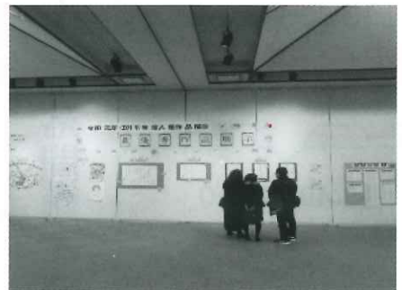
以前の「市民のつどい」講演会・人権作品表彰式・人権作品展示会より